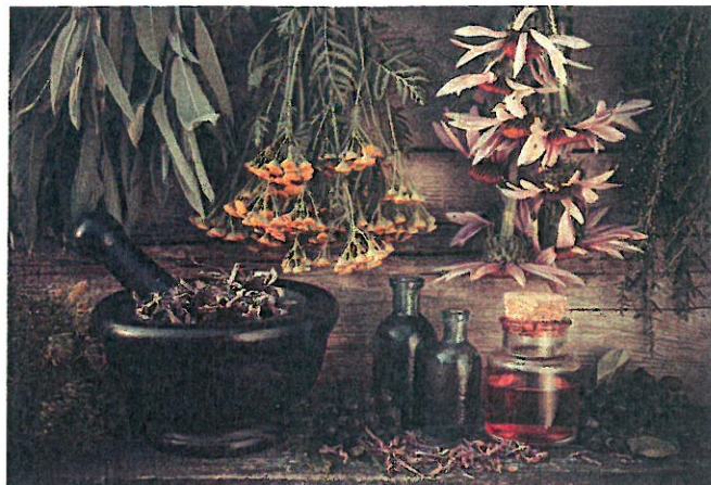
| Homeopathische middelen zijn vrij verkrijgbaar.

Een moeilijk te behandelen groep patiënten is diegene die heel veel klassieke medicatie neemt. Het is dan ingewikkeld om te achterhalen welke symptomen afkomstig zijn van de medicatie en welke de werkelijke symptomen zijn. Het beste zou zijn om met alle medicatie te stoppen en dan de klachten te bekijken.